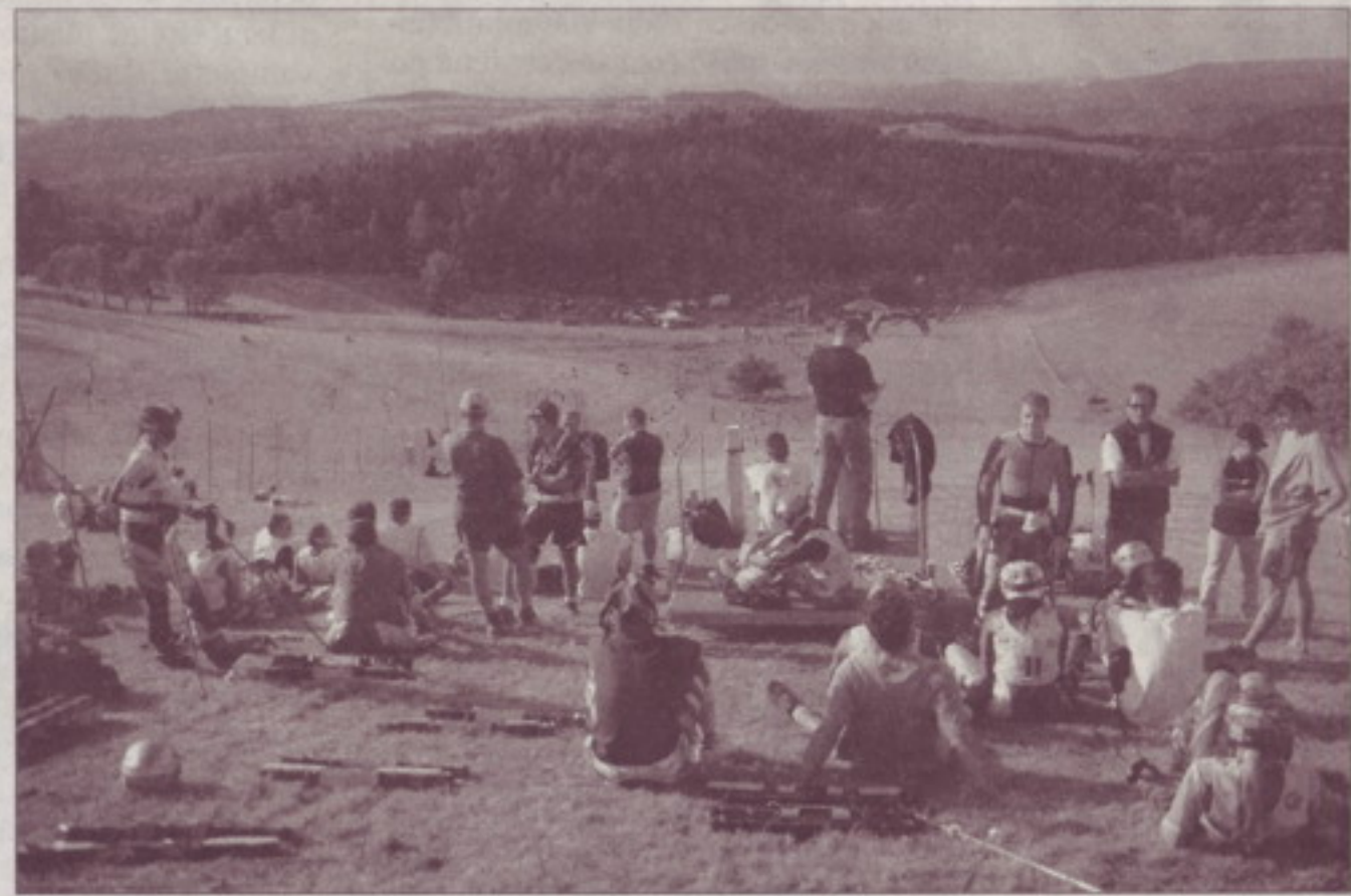
Říká se "Kdo maže, ten jede!" Pro travní lyžování si toto pravidlo musíte lehce poupravit: "Kdo lyže dobře umyje, ten jede!" V cíli rozhodují setiny vteřiny, proto nakonec může rozhodovat každé stéblo trávy, který se usadí v mechanismu speciálních travních lyží. A který mycí přípravek je nejlepší? Závodníci svorně tvrdili, že nejčastěji používají vodu s obyčejným Jarem na nádobí. Na třetím snímku čekání na start na vrcholu olešnické sjezdovky.